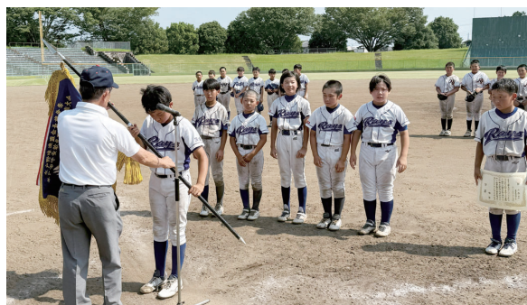
優勝した水戸レイズ