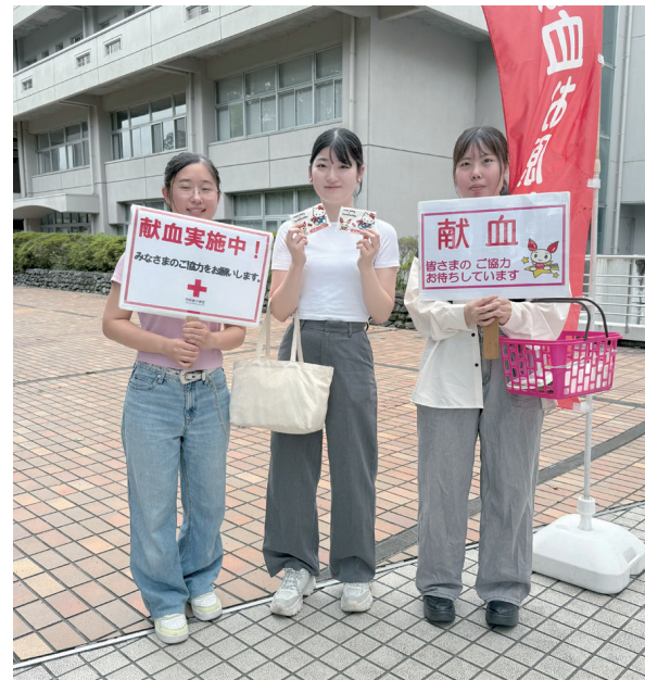
献血の呼びかけに協力してくれた常磐大学の学生さん

す。今回は、常磐大学の赤十字系サークルのメンバーが、プラカードを持って呼びかけ活動をしていました。今回が初めてだそうです。献血のPRに協力していただける人が増えていくことはありがたいことです。クラブメンバーも負けずにPR活動に精を出していきましょう。短時間でもよいのでご協力をお願いします。