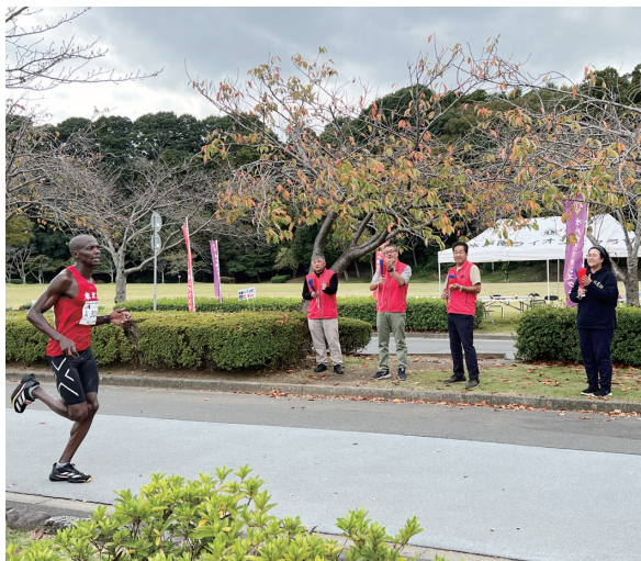
ランナーに声援を送る水戸南LCメンバー

来年は記念すべき10回目となります。エアサロンプラス等を準備して、万全を期して応援隊を継続していきたいと思ひます。