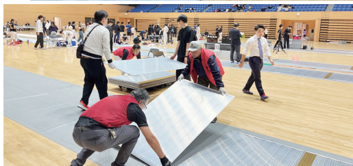
戦いの熱も冷めず後片付け