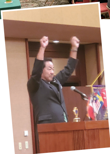
大山会長の ライオンズローア