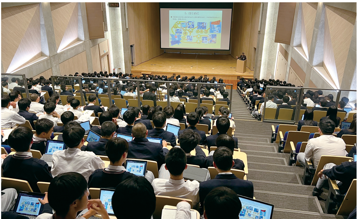
2024.10.21(月) 水城高等学校山野内記念講堂で開催された薬物乱用防止教室